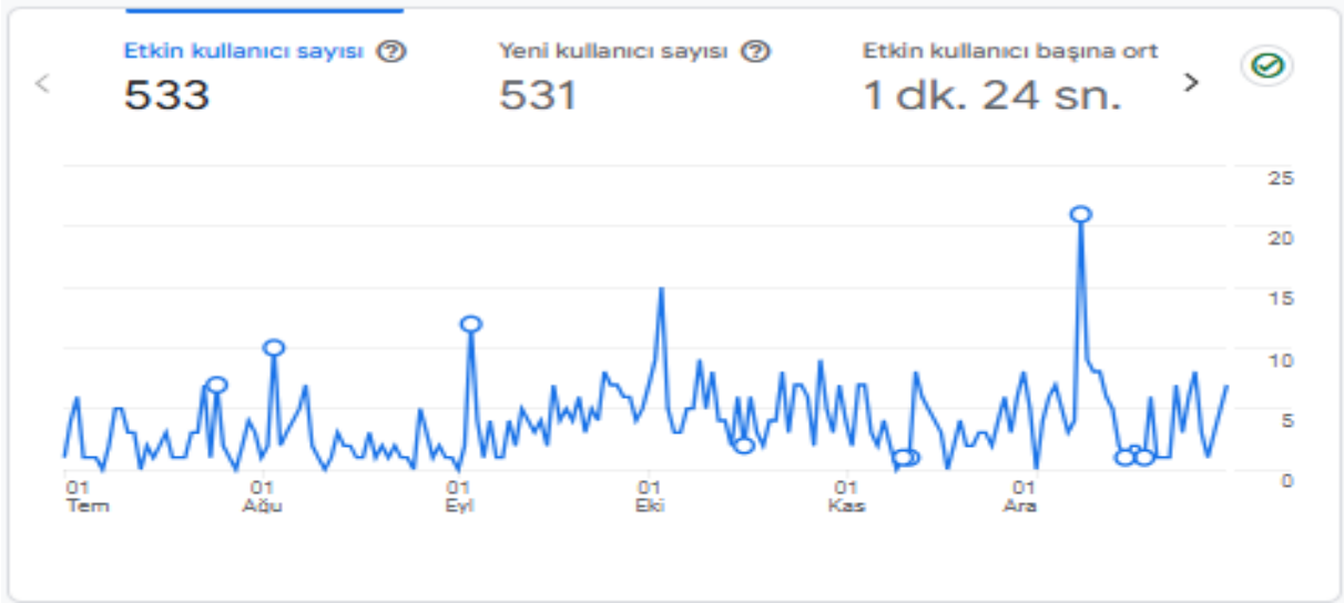
Tablo 1. Toplam Kullanıcı Sayıları (01.07.2024-31.01.2025)

Tablodaki değerler dikkate alındığında, altı aylık dönemde toplam 533 etkin kullanıcının merkezin internet sitesine erişimde bulunduğu görülmektedir. Kullanıcıların internet sitesinde geçirdiği ortalama sürenin de yaklaşık bir buçuk dakika olduğu anlaşılmaktadır. Aralık ayında en yüksek kullanıcı sayısına ulaşılmıştır. Altı aylık dönemdeki kullanıcıların hangi ülkelere merkezin internet sayfasına eriştiğine ilişkin bilgiler ise Tablo 2'de yer almaktadır.