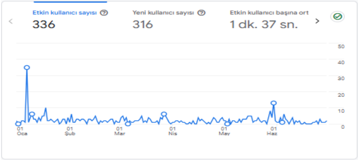
Tablo 1. Toplam Kullanıcı Sayıları (01.01.2024-30.06.2024)

Tablodaki değerler dikkate alındığında, altı aylık dönemde toplam 336 kullanıcının merkezin internet sitesine erişim sağladığı, bunların da 316'sinin yeni kullanıcı olduğu görülmektedir. Kullanıcıların internet sitesinde geçirdiği ortalama sürenin de yaklaşık bir buçuk dakika olduğu anlaşılmaktadır. 2024 yılı itibarıyla merkeze ait eski internet sitesinin kaldırılarak güncel sitenin aktif hale gelmesi ile ocak ayında yüksek bir kullanıcı ziyareti gerçekleşmiş, devamında ise kullanıcı sayısı ortalama bir seyirde devam etmiş olduğu görülmektedir. Altı aylık dönemdeki kullanıcıların hangi ülkelerden merkezin internet sayfasına eriştiğine ilişkin bilgiler ise Tablo 2'de yer almaktadır.