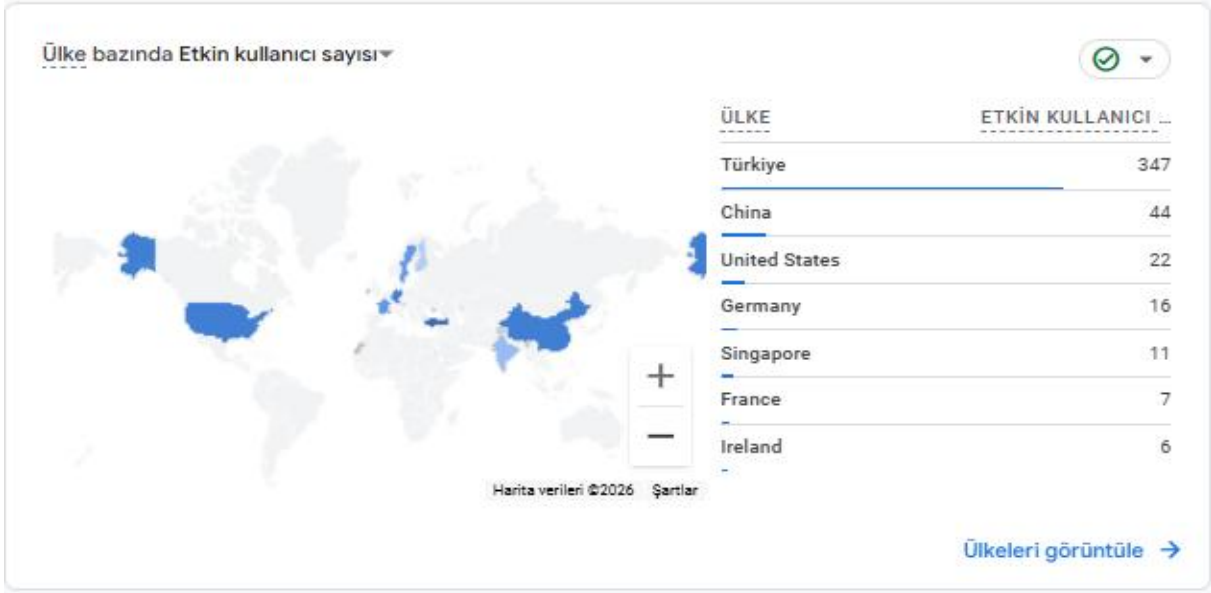
Tablo 2. Kullanıcıların Ülkelere Göre Dağılımı (01.07.2025-31.12.2025)

Merkeze ait internet sitesinin 459 kullanıcısı, 13 farklı ülkeden erişim sağlamıştır. Tablo 2’de en yüksek ziyaretçi sayısına sahip yedi ülkeye ait bilgiler yer almaktadır. Kullanıcıların ülkelere göre dağılımına bakıldığında en yüksek kullanıcı sayısı olan Türkiye’yi (347 kullanıcı), Çin (44 kullanıcı), Amerika Birleşik Devletleri (22 kullanıcı), Almanya (16 kullanıcı) Singapur (11 kullanıcı), Fransa (7 kullanıcı) ve İrlanda (6 kullanıcı) takip ettiği anlaşılmaktadır.