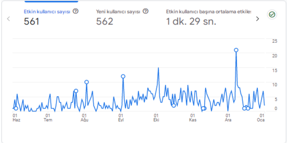
Tablo 1. Toplam Kullanıcı Sayıları (01.06.2024-01.01.2025)

Tablodaki değerler dikkate alındığında, altı aylık dönemde toplam 561 etkin kullanıcının merkezin internet sitesine erişimde bulunduğu görülmektedir. Kullanıcıların internet sitesinde geçirdiği ortalama sürenin de yaklaşık bir buçuk dakika olduğu anlaşılmaktadır. Ağustos ayı itibariyle ortalama kullanıcı sayısında artış yaşanmıştır.