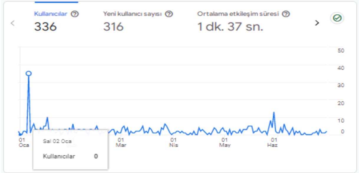
Tablo 1. Toplam Kullanıcı Sayıları (01.01.2024-01.06.2024)

Tablodaki değerler dikkate alındığında, altı aylık dönemde toplam 336 kullanıcının merkezin internet sitesine erişim sağladığı, bunların da 316'sinin yeni kullanıcı olduğu görülmektedir. Kullanıcıların internet sitesinde geçirdiği ortalama sürenin de yaklaşık bir buçuk dakika olduğu anlaşılmaktadır. 2024 yılı itibariyle merkeze ait eski internet sitesinin kaldırılarak güncel sitenin aktif hale gelmesi ile ocak ayında yüksek bir kullanıcı ziyareti gerçekleşmiş, devamında ise kullanıcı sayısı ortalama bir seyirde devam etmiş olduğu görülmektedir. Altı aylık dönemdeki kullanıcıların hangi ülkelerden merkezin internet sayfasına eriştiğine ilişkin bilgiler ise Tablo 2'de yer almaktadır.